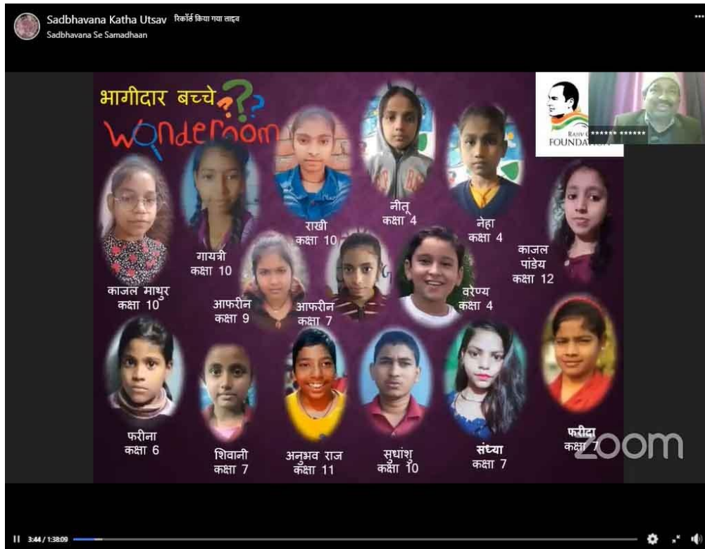
Zoom Participation through Tablet- event organized by Rajiv Gandhi Foundation